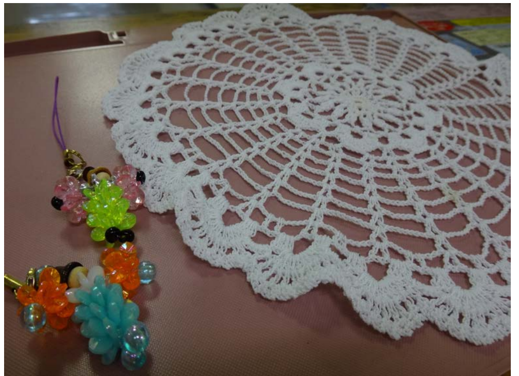
手芸作品 (レース編み・ビーズ細工) H・K