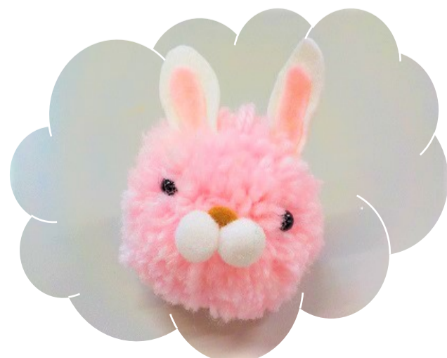
アトリエふれんどりい5月の作品 「毛糸のポンポンマスコット」