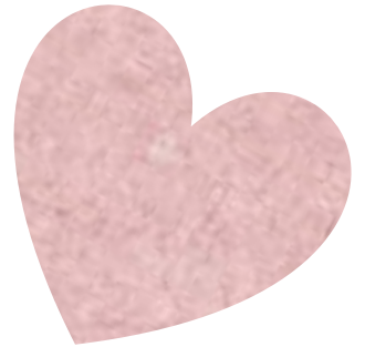
めいえ (ペンネーム: フルー・スカイ)